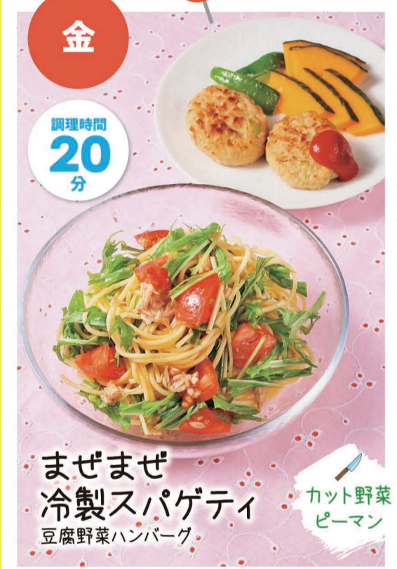
まぜまぜ 冷製スパゲティ 豆腐野菜ハンバーグ