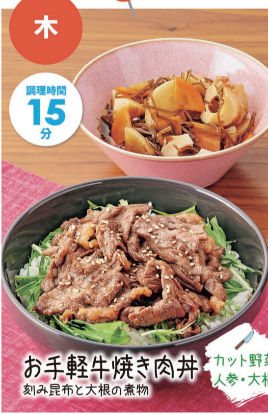
お手軽牛焼き肉丼 刻み昆布と大根の煮物