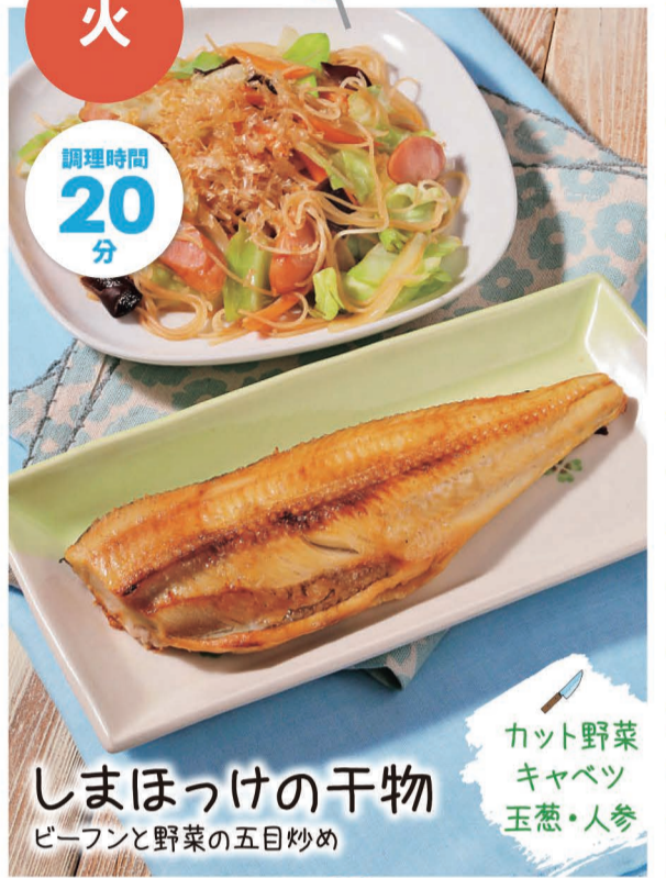
しまほっけの干物 ビーフンと野菜の五目炒め