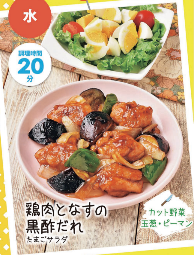
鶏肉となすの 黒酢だれ たまごサラダ